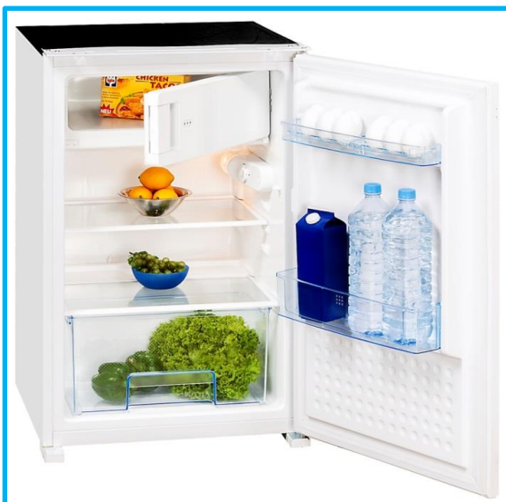
EKS 145-11 A+