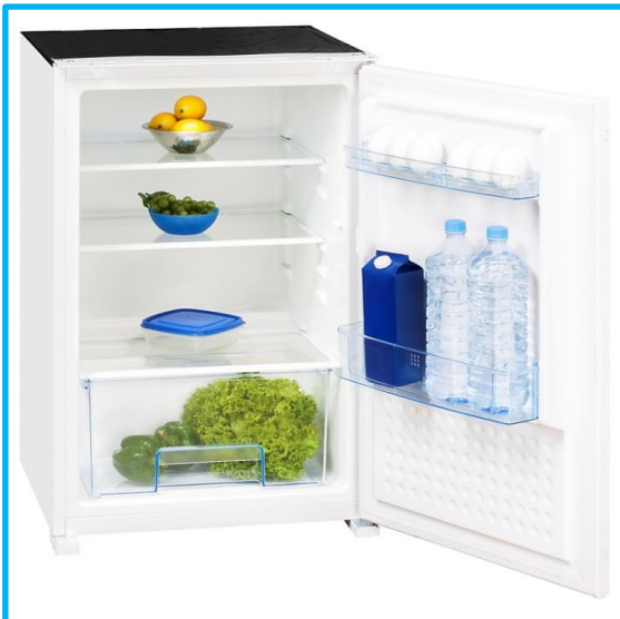
EKS 145-11 RVA+